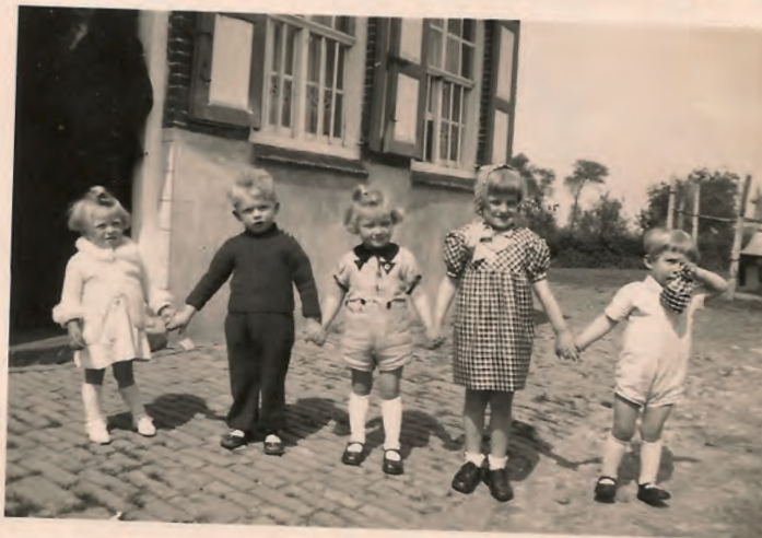
— Kinderen poseren voor een woonhuis in Proven. 1940 - 1942.