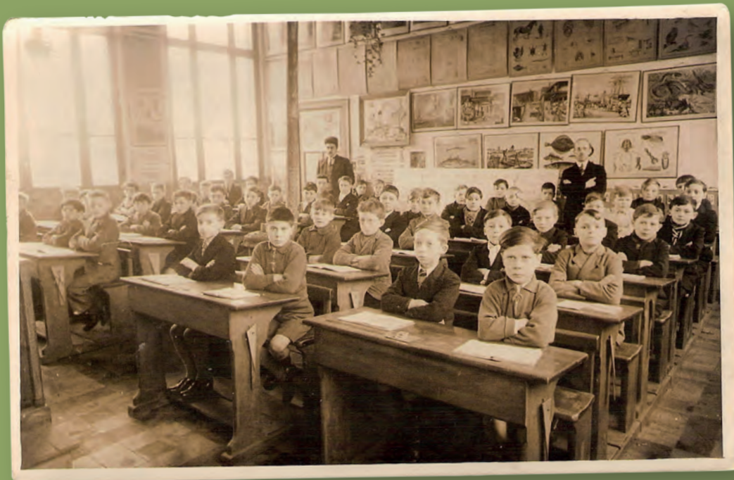
In 1942 poseren de jongens van de knechtescholen van Voormezele in hun klaslokaal.