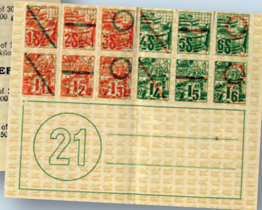
De Poperingenaar – 16 juni 1940

10 dagelijksche rantsoenen van 5 grammen of 50 grammen per zegel, dus 3 zegels bedragen: 3×50 grammen of 150 grammen per maand.